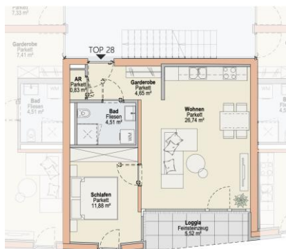
Haus O TOP 28