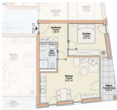
Haus O TOP 27