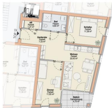
Haus W TOP 12