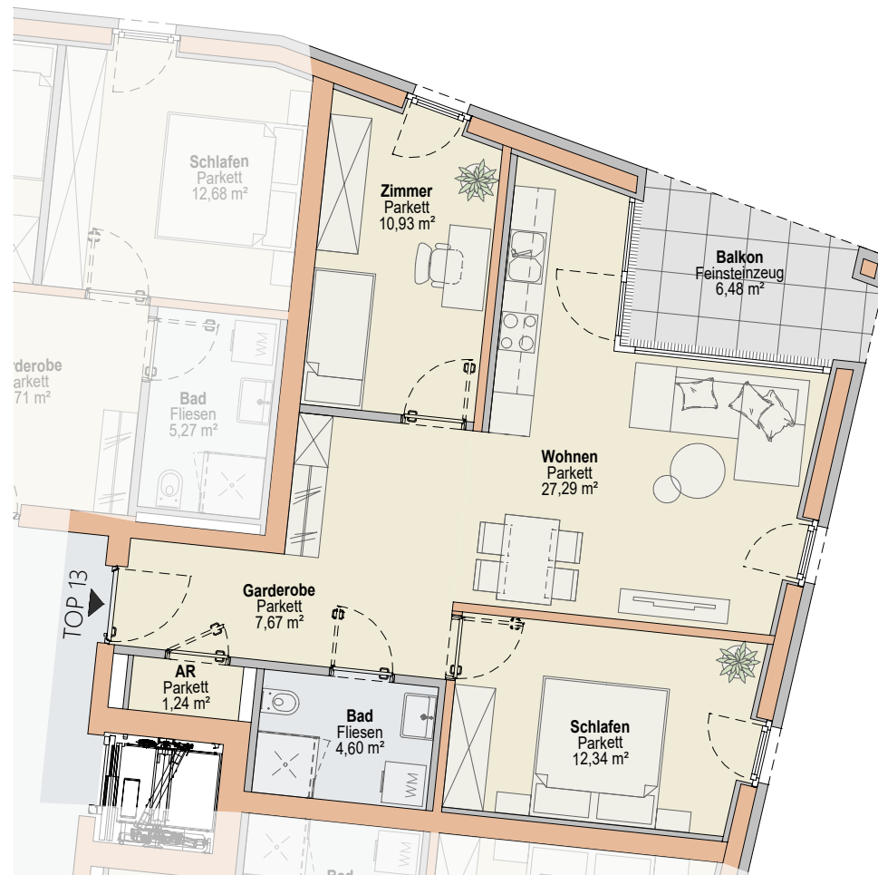
Top 13 - 1:100