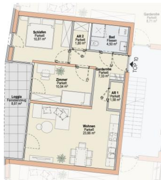
Haus W TOP 10