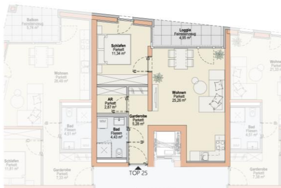
Haus O TOP 25