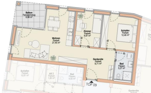
Haus W TOP 09