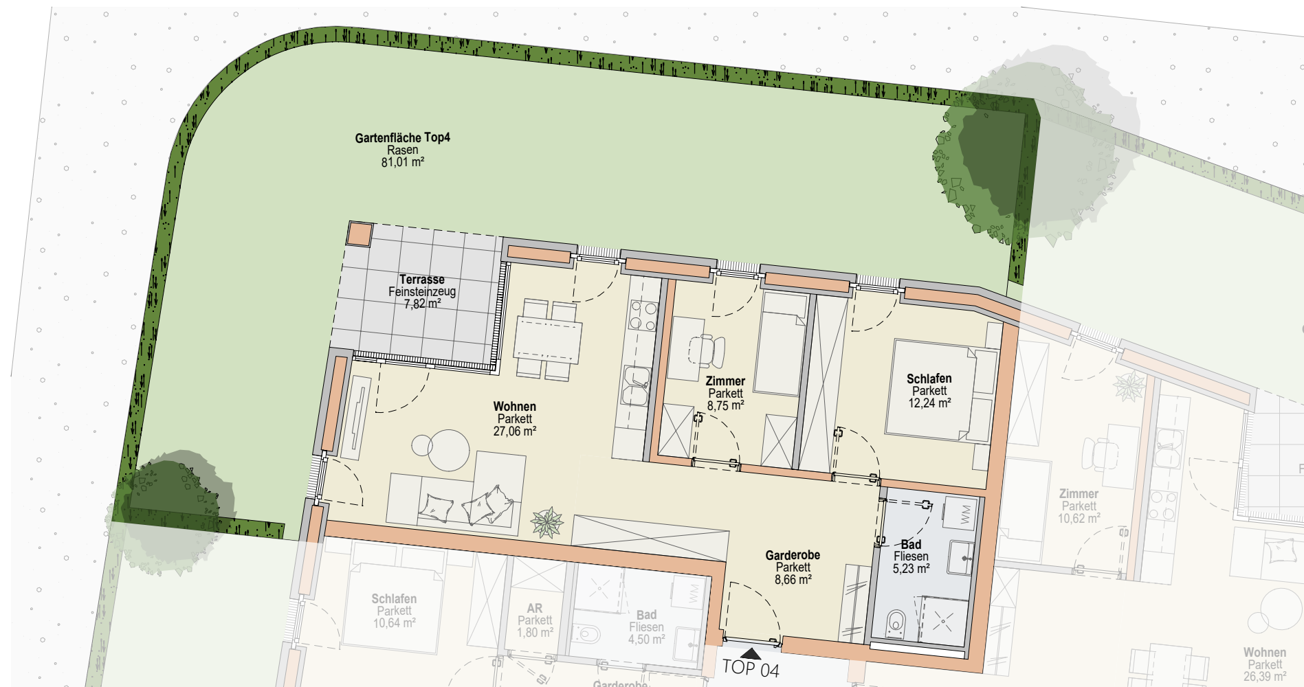
Top 4 - 1:100